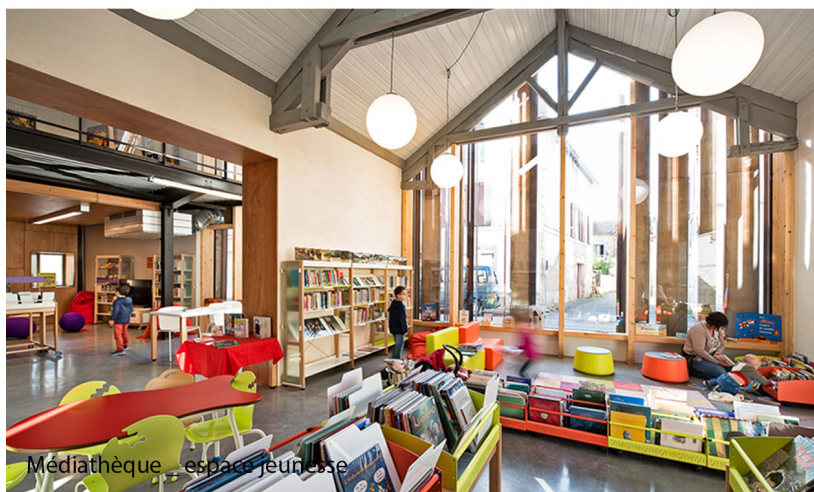
Médiathèque espace jeunesse