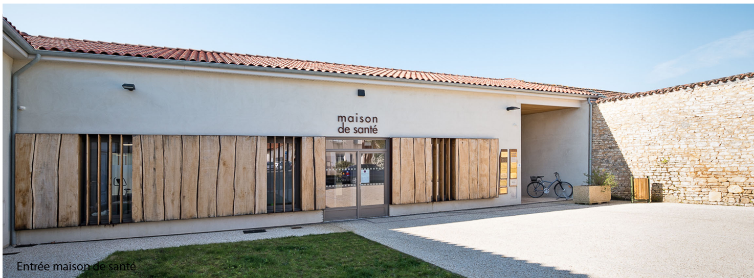
Entrée maison de santé