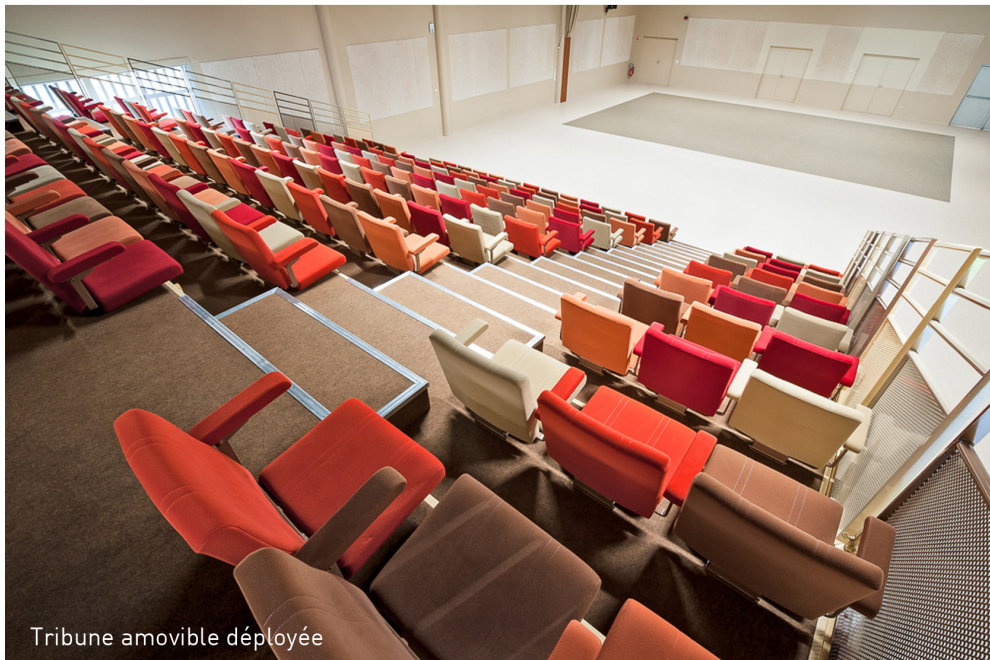
Tribune amovible déployée