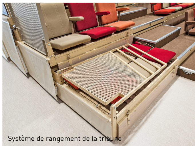
Système de rangement de la tribune