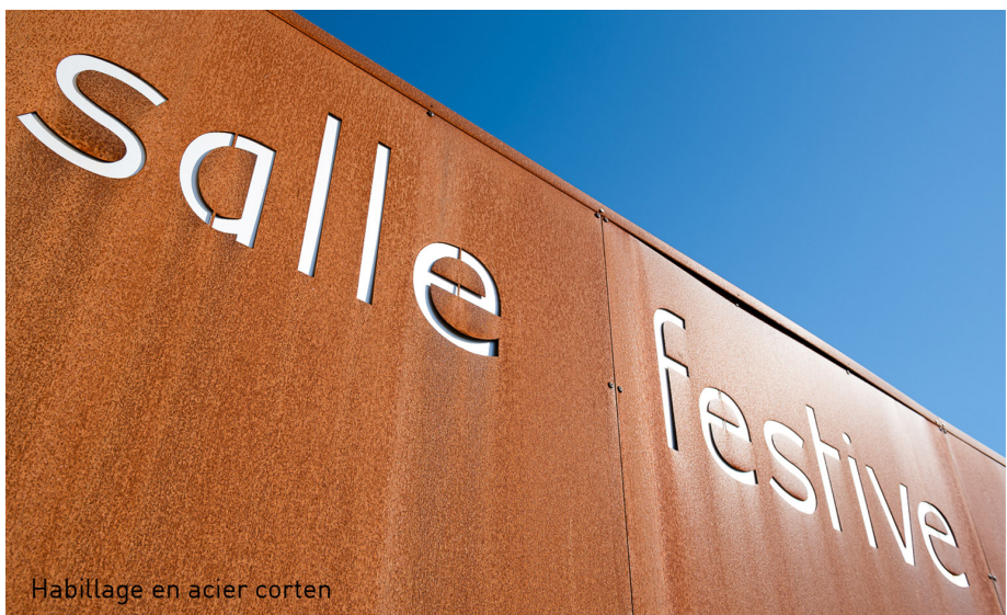
Habillage en acier corten