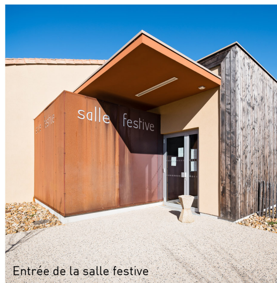
Entrée de la salle festive