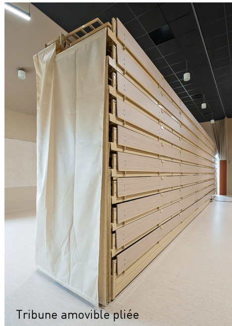
Tribune amovible pliée