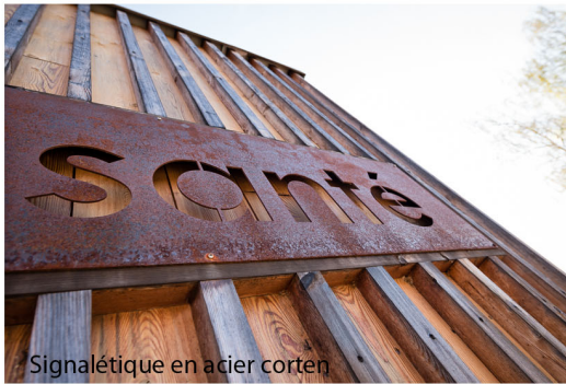
Signalétique en acier corten