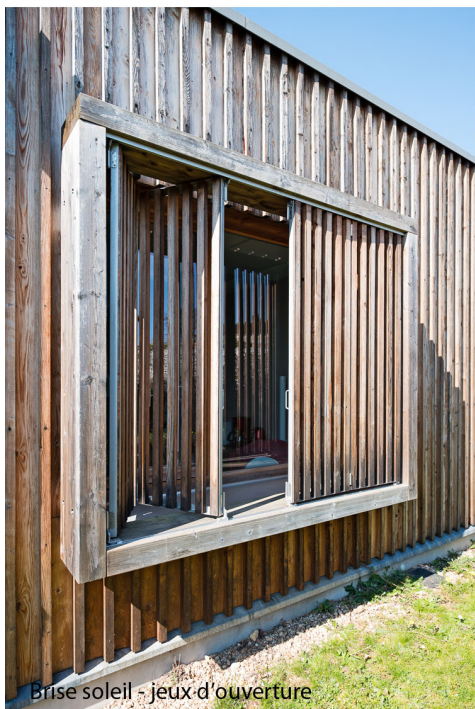
Brise soleil - jeux d'ouverture