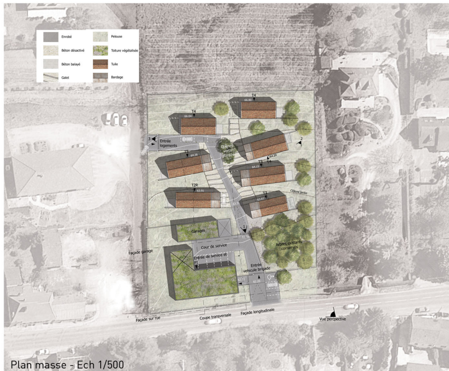
Plan masse - Ech 1/500