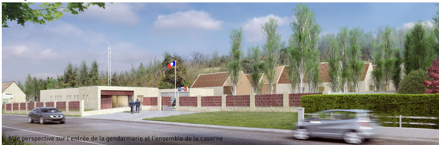
Vue perspective sur l'entrée de la gendarmerie et l'ensemble de la caserne

Le projet s'accroche à un coteau, utilisant une pente qui augmente graduellement en s'éloignant de la route. Dans les hauteurs, les logements ; en contrebas, la brigade et son entrée qui ponctuent l'avenue et marquent l'entrée de la ville. Le traitement de la pente et du ruissellement se fait par mini ressauts en faille enherbée. Les logements forment un hameau à la fois protecteur et offrant des vues agréables. Les maisons dialoguent subtilement avec l'environnement. Elles se réapproprient les volumétries anciennes, réinterprètent le vocabulaire architectural et emploient ses matériaux (tuiles, pierre,...) et leur pérennité. La réponse aux besoins des familles est optimisée : accès individualisé, cave associée accessible depuis le stationnement protégé, la partie jour de plein pied et la partie nuit, bien dissociée, sur deux niveaux. La brigade, par son architecture sobre et rigoureuse, témoigne de la présence institutionnelle et s'inspire des logiques constructives anciennes. La pierre locale, noble et solide, associée à l'acier, encadre l'entrée et compose la clôture qui signale le bâtiment public.