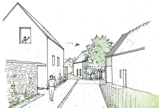
Perspective d'ambiance au cœur du hameau