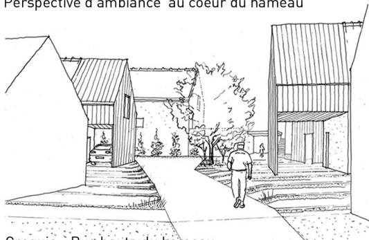
Croquis - Rue haute du hameau