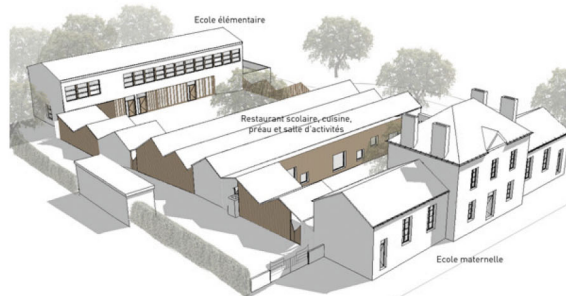
Axonométrie - phase APD