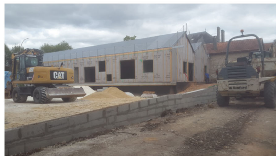
Photos du chantier