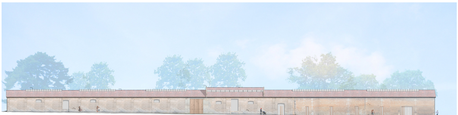
Chais _ Façade Nord _ Rue _ Ech 1/100