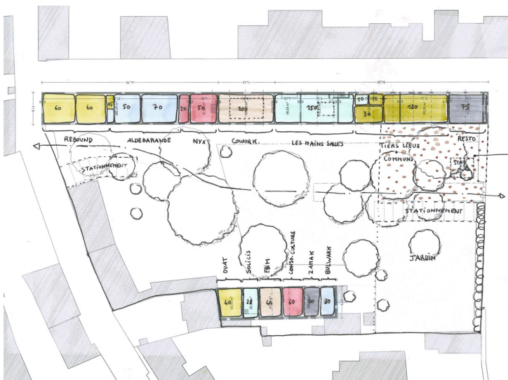
Faisabilité _ Schéma RDC

De manière générale, le projet utilise des matériaux et des couleurs en cohérence avec ceux de l'environnement bâti, notamment avec du badigeon de chaux en façade pour les granges, des menuiseries bois, de l'acier riveté et la conservation des toitures tuiles.