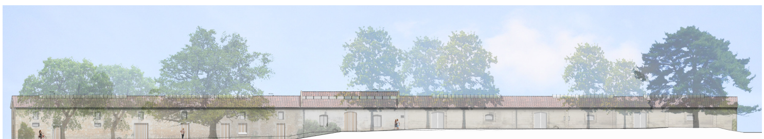
Chais _ Façade Sud _ Parc _ Ech 1/100